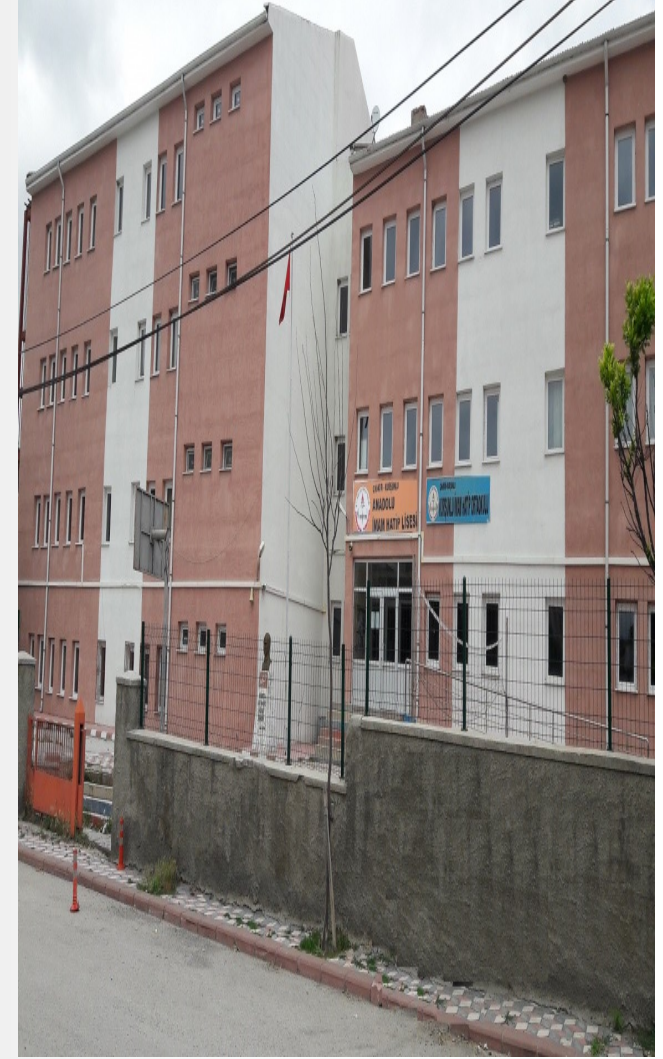
KURŞUNLU ANADOLU İMAM HATİP LİSESİ-ORTAOKULU

Çocuğunuzla onun özgüveni artıracak ve motivasyonunu yükseltecek konuşmalar yapabilirsiniz.